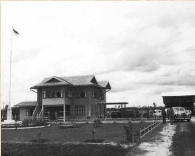
ที่ทำการประมงหนองหาร ช่วงเสด็จฯ ๑๑ - ๑๒ พ.ย. ๒๔๙๘

ในการเตรียมการรับเสด็จพระราชดำเนินในครั้งนั้น ได้รับความร่วมแรงร่วมใจอย่างแข็งขันจากข้าราชการและบุคลากรหลายฝ่าย